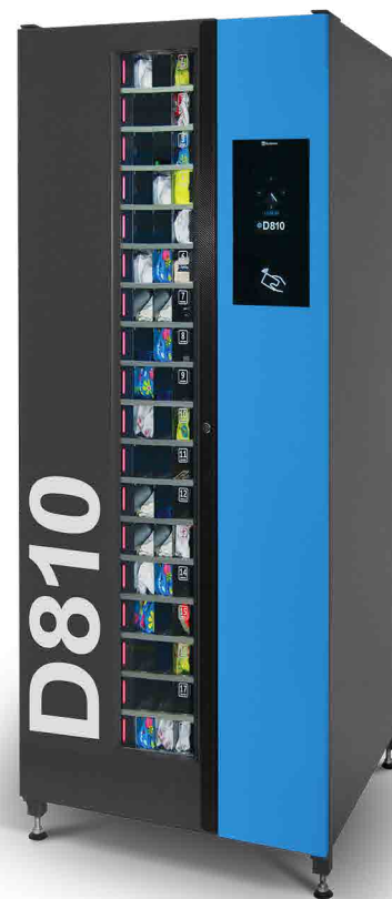
Automat dostępny w wersji z panelem użytkownika oraz bez panelu użytkownika

3 Trzeci sposób to innowacyjny system skanowania bębna , który automatycznie wykrywa miejsca w które zostały załadowane produkty do maszyny, co znacząco skraca czas ładowania.