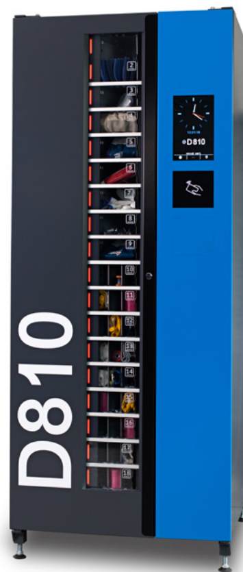
Automat verfügbar in der BASIC, PRO und „T“-Version