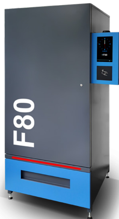
Automatisch in Panel-Version verfügbar Benutzer ohne Benutzerpanel

Die beeindruckende Ladekapazität des Geräts wird durch die Möglichkeit erreicht, verschiedene Arten von Federwicklungen in bis zu 36 Konfigurationen des Federhubs zu verwenden. Es können bis zu 8 Brettern mit je 10 Federn montiert werden, die für größere Produkte paarweise kombiniert werden können. Die Konfiguration der Federn ist unbegrenzt, Einzel- und Doppelfedern verschiedener Größen können gleichzeitig auf einem Brett installiert werden. Durch die einfache Änderung der Einstellungen kann die Kapazität der Maschine jedes Mal an den aktuellen Betriebsbedarf angepasst werden. Darüber hinaus ist das Brett mit Gleitblöcken, inneren Federrutschen und unterschiedlich hohen Trennwänden ausgestattet, die es ermöglichen, Produkte mit unterschiedlichen Geometrien und Packungsmustern auszugeben.